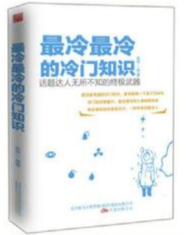
书名:《最冷最冷的冷知识》 作者:赵伟 出版社:万卷出版公司